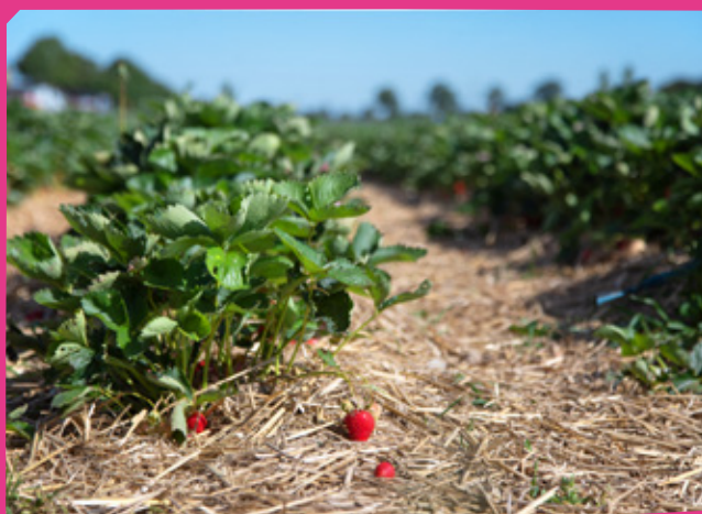
Erdbeerfeld in Nordrhein-Westfalen im Juni 2022