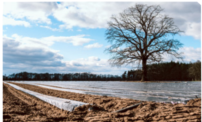
Mit Planen abgedecktes Erdbeerfeld in Vetschau, Brandenburg.

Branchenexpert*innen erläutern, dass gerade bei Erdbeeren einige vorwiegend kleine Betriebe aufgrund des enormen Preisdrucks in den vergangenen Jahren aus dem Geschäft mit dem Lebensmitteleinzelhandel ausgestiegen sind.